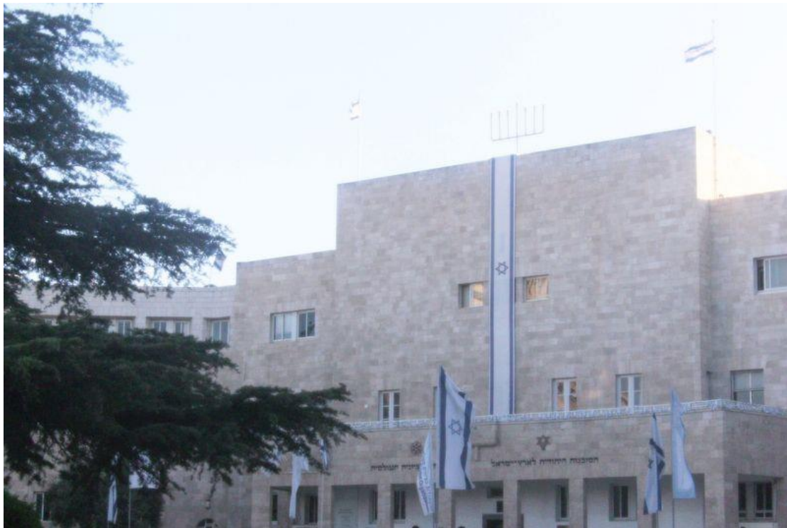
בית המוסדות הלאומיים

בניין המוסדות הלאומיים נבנה על אדמה שנרכשה בשנות העשרים של המאה הקודמת על ידי הנהגת חברת "הכשרת הישוב" וד"ר ארתור רופין. המגרש, בפינת הרחובות המלך ג'ורג' והקרן